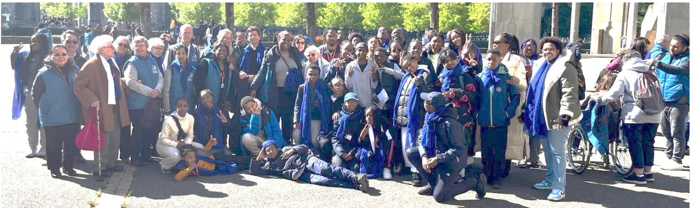
Les paroissiens et les jeunes de Cergy à Lourdes